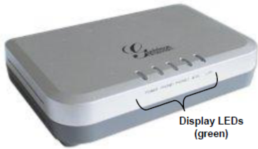
HT-502 Front View